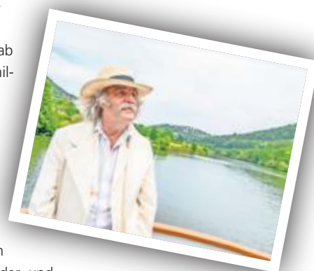
Mit Mark Twain auf dem Neckar.