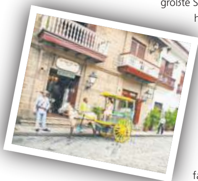
Beliebte Ausflugsziele sind die Hauptstadt Manila (oben) und die Chocolate Hills (unten).