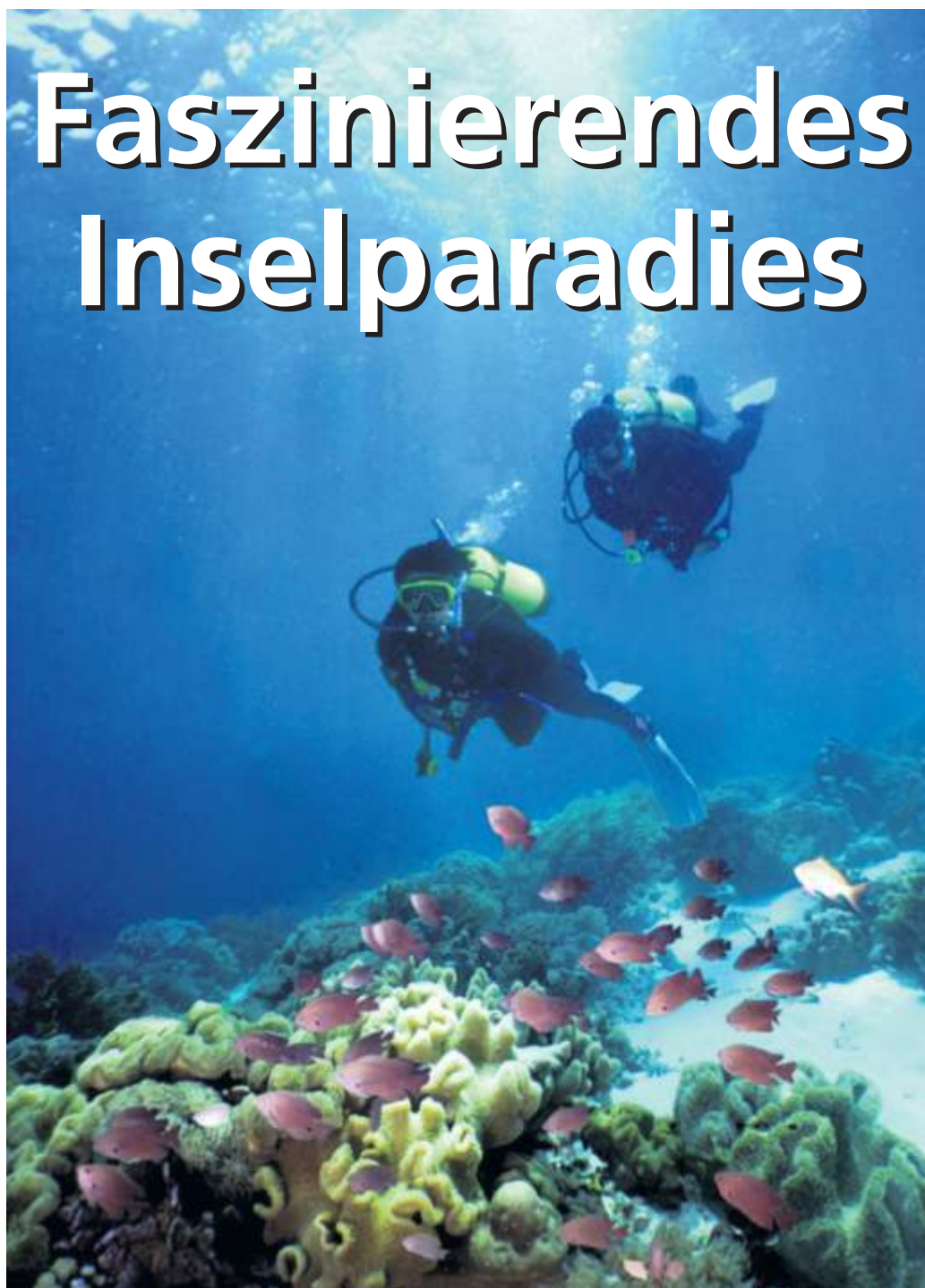
Farbenfrohe Korallen, unzählige Fischarten und versunkene Schiffswracks machen die Region zu einem Eldorado für Taucher.

hängendem tropischen Regenwald des Landes ist der Northern Sierra Madre Natural Park. Der Naturpark im Herzen der Insel Luzon erstreckt sich über eine Fläche von fast 360 000 Hektar – über 500 Fußballfelder – und ist an biologischer Vielfalt und Artenreichtum kaum zu übertreffen. Zahlreiche indigene Völker sind hier beheimatet und tragen mit ihren Bräuchen und Traditionen zum Erhalt des Kulturerbes bei. Aktivurlauberinnen und -urlauber begeben sich auf Wanderrouten verschiedener Niveaus, das Angebot reicht von Wanderungen durch die Berge der westlichen Visayas auf der Insel Panay bis hin zu mehrtägigen Trekkingtouren durch die Reisfelder von Banaue, die zum Unesco-Welterbe zählen. Ein beliebtes Ausflugsziel sind auch die sanft-hügeligen Chocolate Hills auf der Insel Bohol. Über 1000 symmetrische Hügel vulkanischen Ursprungs ragen hier, je nach Jahreszeit saftig-grün oder schokoladenbraun, in den Himmel. Ein weiteres Wahrzeichen der Insel Bohol sind die possierlichen Koboldmakis, die sich nur mit etwas Glück