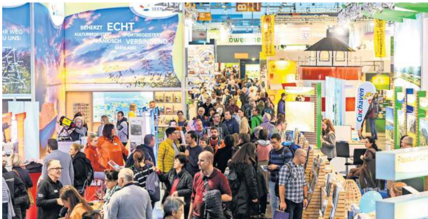
Die Deutschen haben wieder Lust zu reisen – und informieren sich auf der CMT über Urlaubsziele, Aktivitäten und Trends.

Druck: MHS Print GmbH, Plieninger Straße 150, 70567 Stuttgart, gesetzlich vertreten durch den Geschäftsführer Johannes Degen.