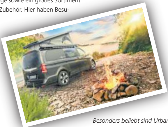
Besonders beliebt sind Urban Camper wie der VANTourer von EuroCaravaning, die sich ideal für den spontanen Campingtrip zwischendurch eignen.