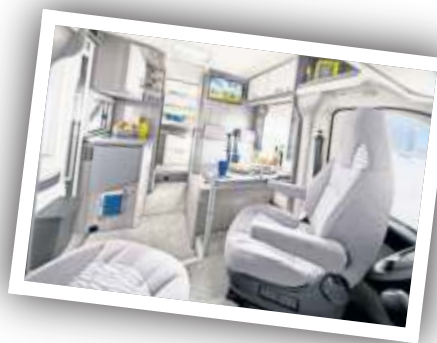
Auf der CMT gibt es viele Neuheiten zu sehen, etwa den c-tourer I 145 RB LE von Carthago (Foto oben) oder die On-tour-Modelle von Hobby (links).

finden Vorträge von Bloggerinnen und Bloggern zu den Themen Van-ausbau oder New Work statt. Expertinnen und Experten informieren außerdem über individuelle Herausforderungen beim Umbau, Ausbau und beim täglichen Campen. Jeder Tag widmet sich auf der Fläche einem anderen Thema. So geht es am Mittwoch, 17. Januar, zum Beispiel um Reisen mit dem Hund, und drei Tage später um DIY im Van-Bereich. Aber auch das Thema Nachhaltigkeit im Caravaning bekommt einen hohen Stellenwert auf der CMT 2024. An einer Informationsfläche im Eingang Ost finden Interessierte Wissenswerte zum umweltfreundlichen Urlaub. Brigitte Bonder