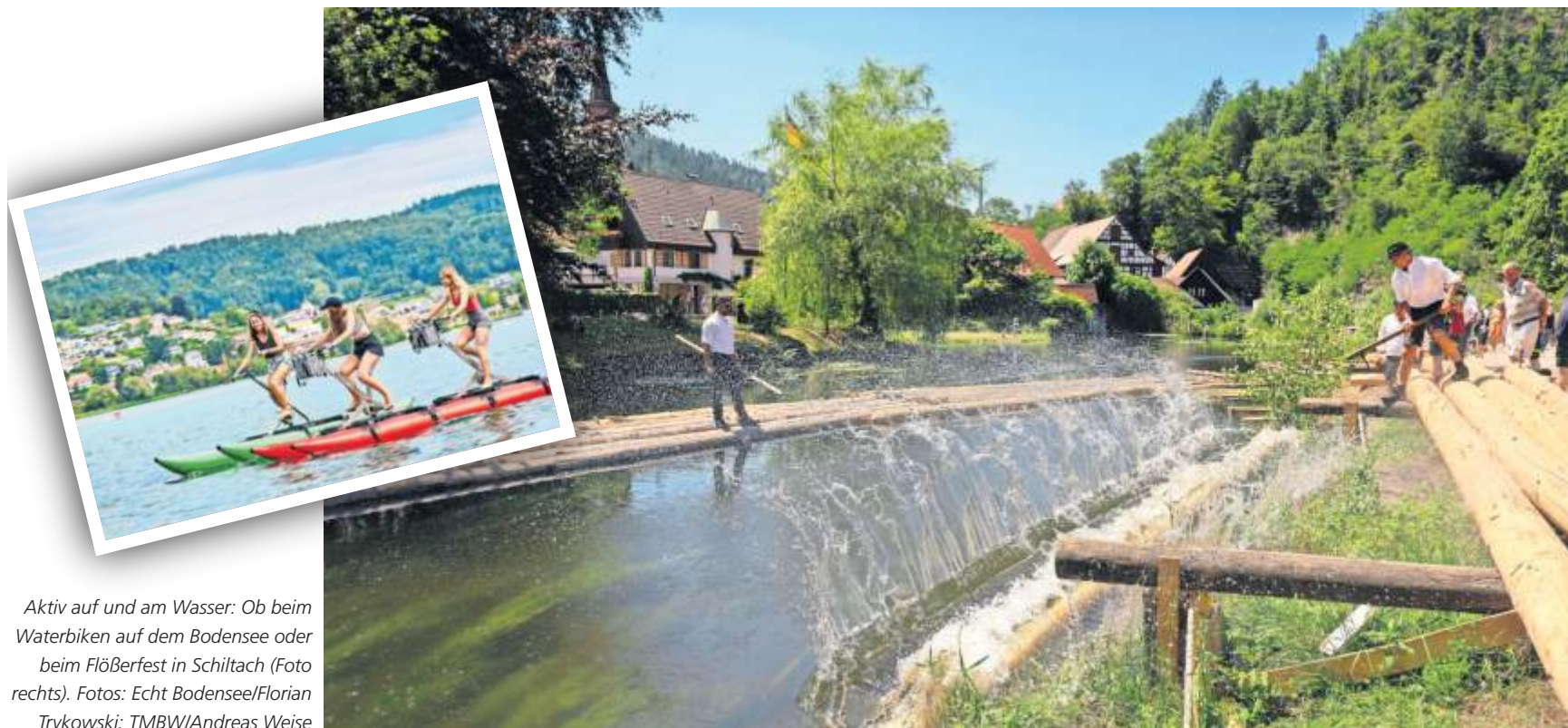
Aktiv auf und am Wasser: Ob beim Waterbiken auf dem Bodensee oder beim Flößerfest in Schiltach (Foto rechts).