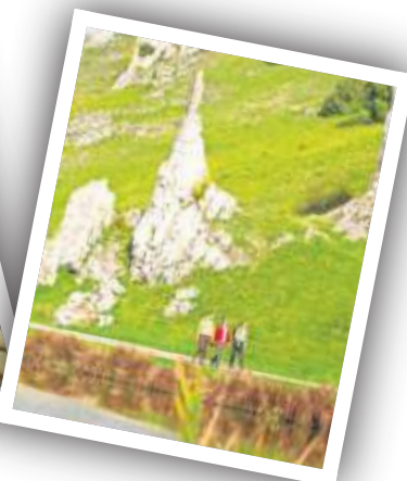
Schafherde bei Heidenheim (oben), kulinarische Highlights beim Sternekoch, wo auch die Maultaschenherstellung beherrscht wird, und Jurafelsen im Eselsburger Tal (unten).