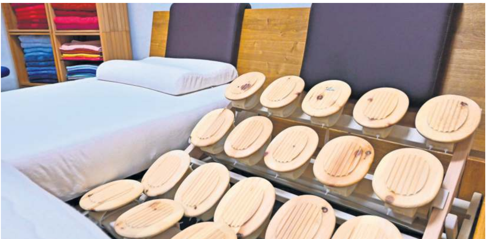
Der Tellerrost „Relax 2000“ aus Naturholz: jeder Teller ist individuell einstellbar. Außerdem ist die Einsenkttiefe für breite Schultern gewährleistet, dazu eine Naturlatexmatratze.