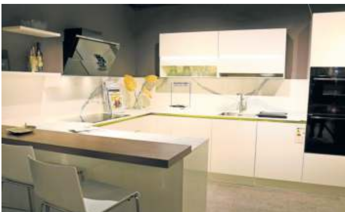
Die schöne Welt exklusiver Küchen entdecken: Die Living Küchen GmbH verfügt über eine 270 Quadratmeter große Ausstellungsfläche, die mehr als inspirierend wirkt.

Bald wird Craig Taylor, der auch eigene Gewürzmischungen kreiert, bei Living Küchen demonstrieren, wie herrlich sich in einer Traumküche kulinarische Köstlichkeiten zaubern lassen. Wer beim großen Kochen dabei sein will, kann sich auf der Homepage www.taylors-kitchen.net anmelden.