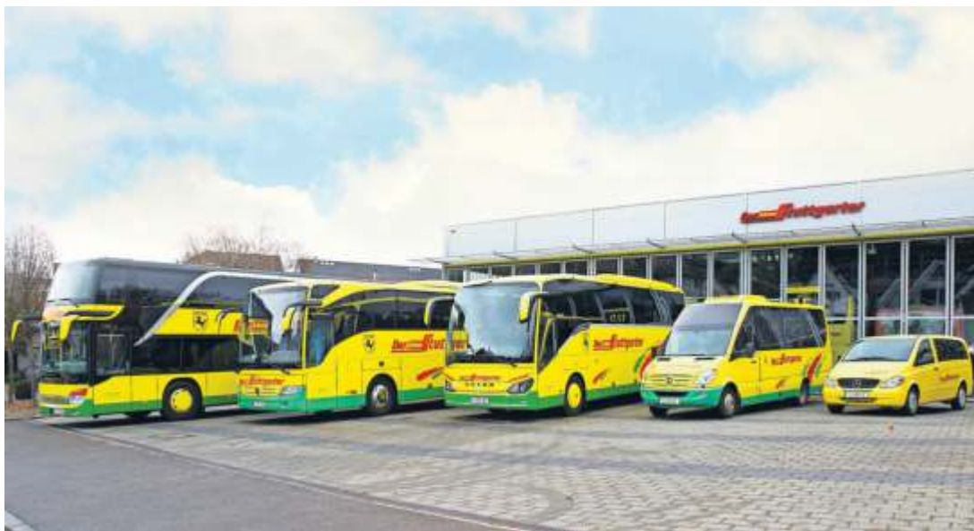
Die Flotte des Reiseprofis.

Ein großer Vorteil ist zudem, dass die Kunden die Organisation komplett aus einer Hand bekommen: von der Hotelbuchung und Reiseleitung vor Ort bis hin zur Verpflegung. Und bevor es überhaupt losgeht,