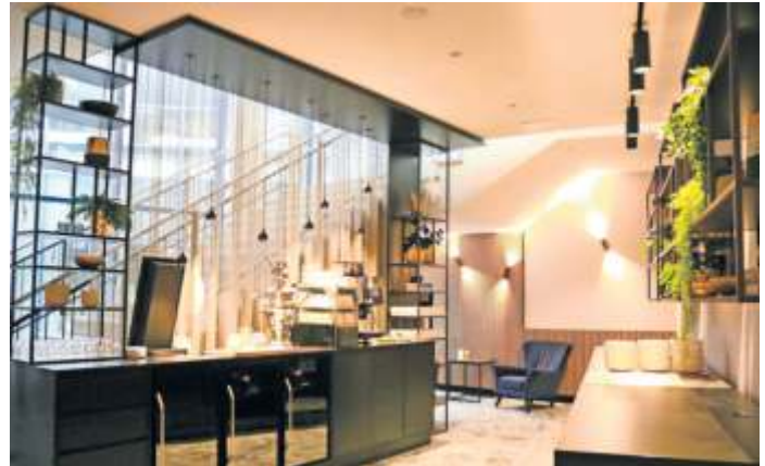
Im Holiday Inn können Gäste schöne Tage und Nächte verbringen – in Zimmern mit allem Komfort und freundlichem Service.

Das Holiday Inn präsentiert regelmäßig neue Aktionen und Angebote, die perfekt zur Jahreszeit passen. Beispielsweise „Gansheitlich lecker“ im November und Dezember, „Trut-hahn satt“ zu Thanksgiving und besondere Weihnachtsmenüs. Und der Sommergarten verwandelt sich in der kalten Jahreszeit in ein Winter Wonderland. Dort gibt es Glühwein rot und weiß, Eierlikör im Schokobecher oder Zimt-Appelpunsch, dazu Pilzpfanne mit Schnupfnudeln, Kesselgulasch, Rote und Bratwurst und zum Nachtisch Germknödel, Crêpes und Bratäpfel. Das Winter Wonderland startet am 27. November und hat