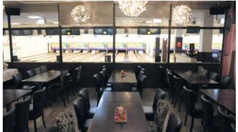
Die Bowling Arena – inklusive geräumigem Restaurant und fünf Veranstaltungsräumen – ist für kleine und große Bowlingfans genau die richtige Adresse.

In der Bowling Arena ist immer was los. Das attraktive Wochenprogramm hält viele Höhepunkte – wechselnde Angebote und Events – für kleine und große Bowlingfans parat, etwa mit dem Moonlight-Bowling. Und es gibt auch immer wieder Veranstaltungen im Haus – wie zuletzt das Bowl-O-ween an Halloween mit