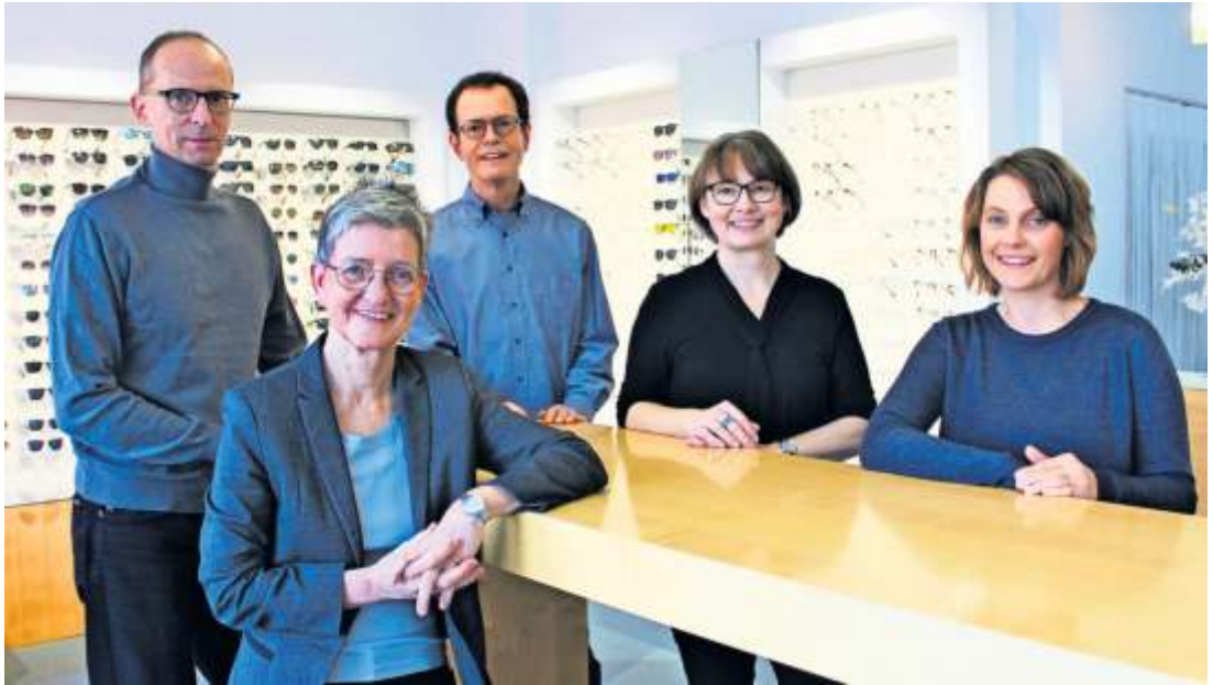
Die persönliche Beratung hat hier oberste Priorität.

Ist ein Probetragen eines Hörgerätes erwünscht, werden zusätzliche Messungen durchgeführt. Die Nachsorge nach erfolgreichem Kauf ist nach wie vor gegeben.