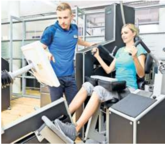
Um die Tiefenmuskulatur effizient zu kräftigen, setzt Kieser Training die Lumbar-Extension-Maschine ein.

Effizient Muskeln trainieren und Kraft aufbauen – dafür steht Kieser Training seit 56 Jahren. Das Unternehmen gilt als Pionier im gesundheitsorientierten Krafttraining für den Rücken und den ganzen Körper. Gegenwärtig umfasst die Gruppe über 150 Studios in Australien, Deutschland, Österreich, Luxemburg und der Schweiz. Ein integraler Bestandteil von Kieser Training sind spezialisierte, nach aktuellen medizinischen Erkenntnissen entwickelte Maschinen. Wie sehr sie